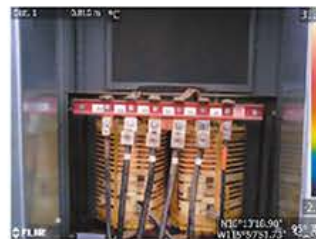
デジタルカメラモード

MSX®機能(スーパーファインコントラスト機能)は、リアルタイムで画像を補正することができ、構造物の詳細や発熱箇所の判別が熱画像上で容易に行えます。また、デジタルカメラモードとの同時撮影も可能で、同画角の可視画像を簡単に生成することができます。