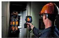
距離測定(レーザーオートフォーカス)