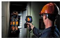
距離測定(レーザーオートフォーカス)