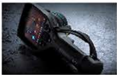
国内フルメンテナンス