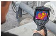
高視野角 高輝度IPS液晶