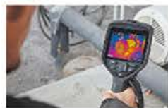
高視野角 高輝度IPS液晶