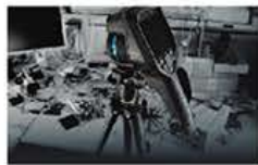
動画・タイムラプス撮影