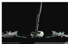
カバーガラスにDragontrail ® 採用