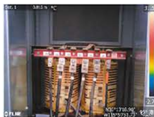
デジタルカメラモード

MSX ® 機能(スーパーファインコントラスト機能)は、リアルタイムで画像を補正することができ、構造物の詳細や発熱箇所の判別が熱画像上で容易に行えます。また、デジタルカメラモードとの同時撮影も可能で、同画角の可視画像を簡単に生成することができます。