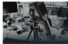
動画・タイムラプス撮影