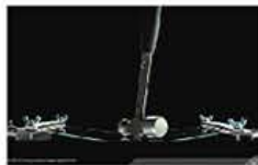
カバーガラスにDragontrail®採用