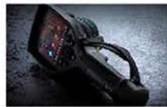
国内フルメンテナンス